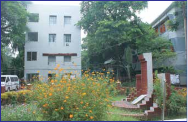
প্রশাসনিক ভবন (ভবন-১)

অধ্যক্ষ ও উপাধ্যক্ষ মহোদয়ের কার্যালয় এবং অফিসকক্ষ