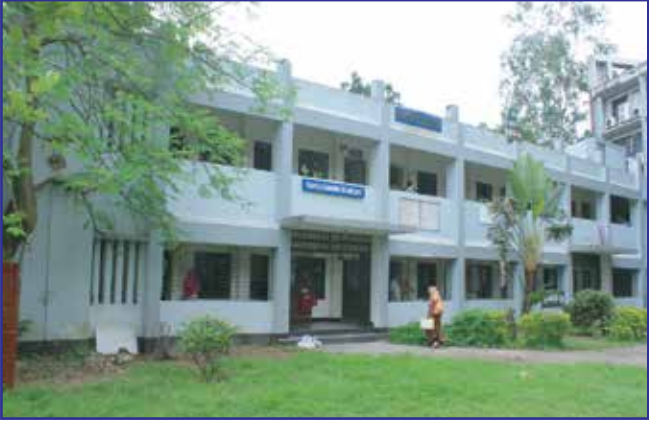
একাডেমিক ভবন (ভবন-৬)

নীচতলা- ফিন্যান্স এন্ড ব্যাংকিং বিভাগ ২য় তলা- মার্কেটিং বিভাগ