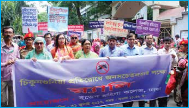
চিকুনগুনিয়া প্রতিরোধে জনসচেতনতার লক্ষ্যে ইডেন মহিলা কলেজ আয়োজিত র্যালিতে অধ্যক্ষ, উপাধ্যক্ষ ও শিক্ষার্থীবৃন্দ