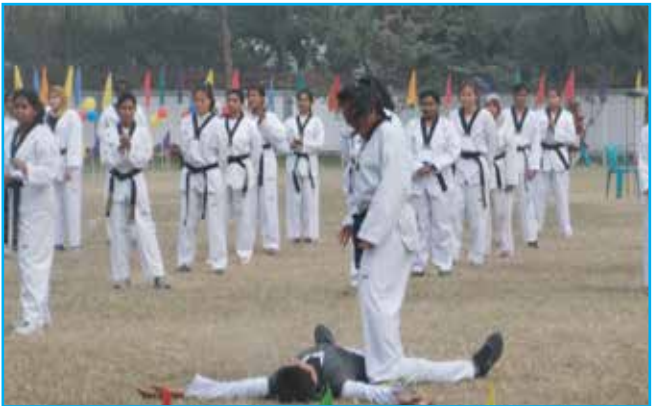
শারীরিক কসরতে ব্যস্ত কলেজের কোরিয়াভিত্তিক তায়কোয়ানদো এর সদস্যরা