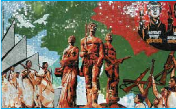
মুক্তিযুদ্ধের স্মৃতিসম্বলিত ম্যুরাল