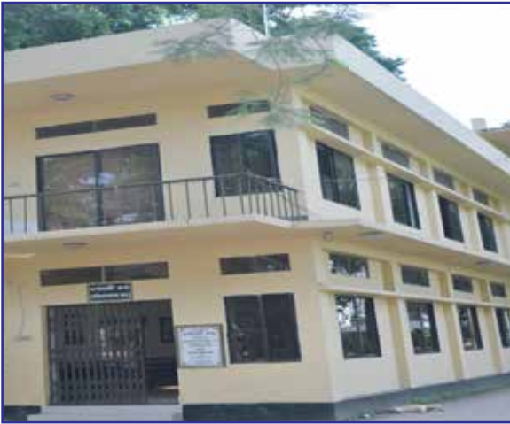
অভিভাবকদের জন্য দর্শনার্থী কক্ষ

নীচতলা- ফিন্যান্স এন্ড ব্যাংকিং বিভাগ ২য় তলা- মার্কেটিং বিভাগ