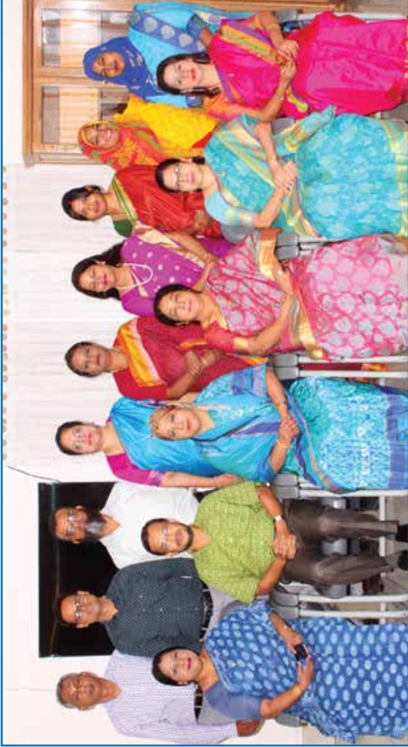
অধ্যক্ষ ও উপাধ্যক্ষ মহোদয়ের সাথে শিক্ষক পরিষদের সম্পাদক ও অন্যান্য সদস্যবৃন্দ