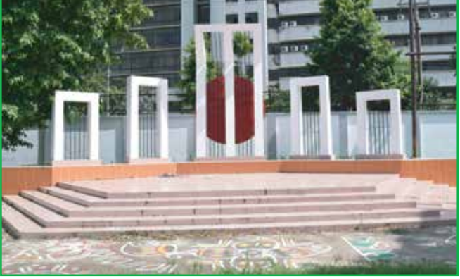
ইডেন মহিলা কলেজের শহীদ মিনার: দেশমাতৃকার সেবায় আত্মত্যাগী শহীদদের স্মরণস্তম্ভ