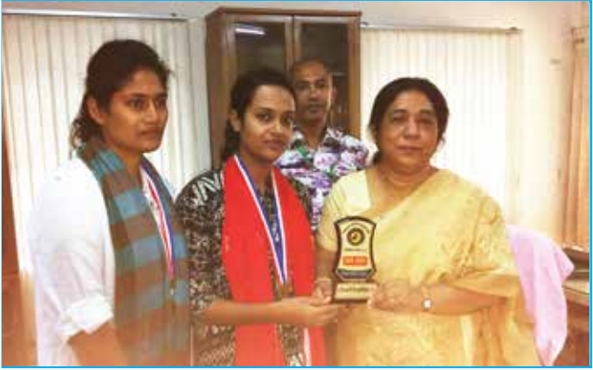
বিএনসিসির শ্রেষ্ঠ প্লাটুন হিসেবে ইডেন মহিলা কলেজের শিক্ষার্থীরা স্বীকৃতি পাওয়ায় অধ্যক্ষ মহোদয়ের অভিনন্দন