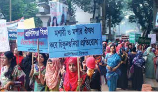
চিকুনগুনিয়া প্রতিরোধে জনসচেতনতার লক্ষ্যে ইডেন মহিলা কলেজ আয়োজিত র্যালিতে শিক্ষার্থীদের অংশগ্রহণ