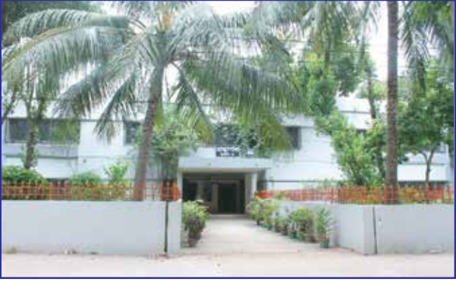
কলেজ গ্রন্থাগার (ভবন-৪)

মহা সমুদ্রের শত বৎসরের কল্লোল কেহ যদি এমন করিয়া বাঁধিয়া রাখিতে পারিত যে, সে ঘুমাইয়া পড়া শিশুটির মত চুপ করিয়া থাকিত, তবে সেই নীরব মহাশব্দের সহিত এই লাইব্রেরির তুলনা হইত।