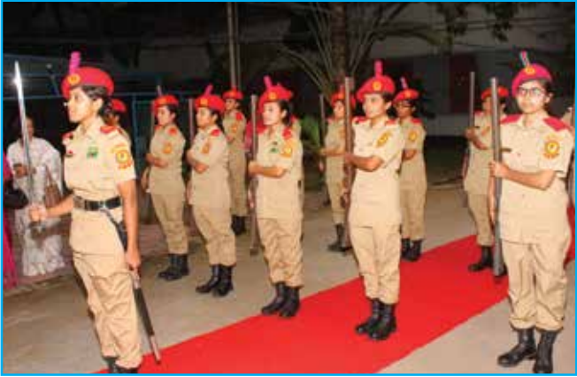
ইডেন মহিলা কলেজের বিএনসিসি