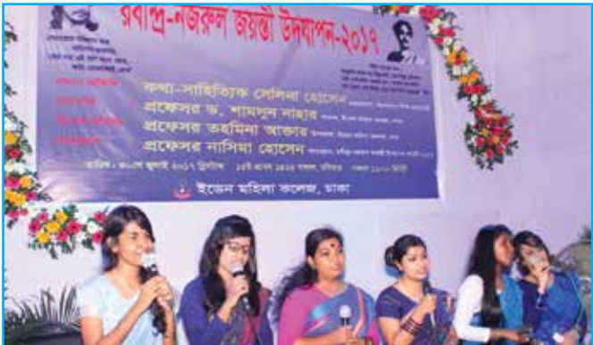
রবীন্দ্র-নজরুল জয়ন্তী-২০১৭ তে সঙ্গীত পরিবেশন করছে ইডেন মহিলা কলেজের শিক্ষার্থীবৃন্দ