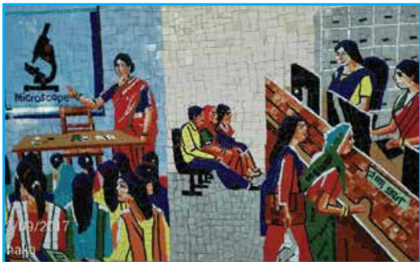
ইডেন মহিলা কলেজে নারীশিক্ষা ভিত্তিক দৃষ্টিনন্দন ম্যুরাল