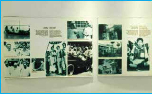
কলেজে বঙ্গবন্ধু শেখ মুজিবুর রহমানের কর্মময় জীবনভিত্তিক স্থিরচিত্র গ্যালারী