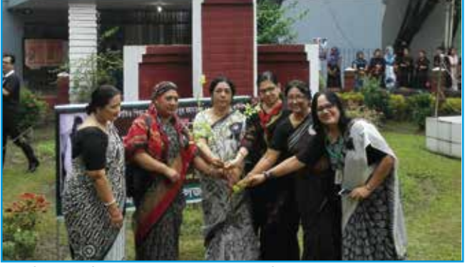
বিপন্ন প্রজাতির বৃক্ষ রোপণ করছেন ইডেন মহিলা কলেজের অধ্যক্ষ মহোদয়