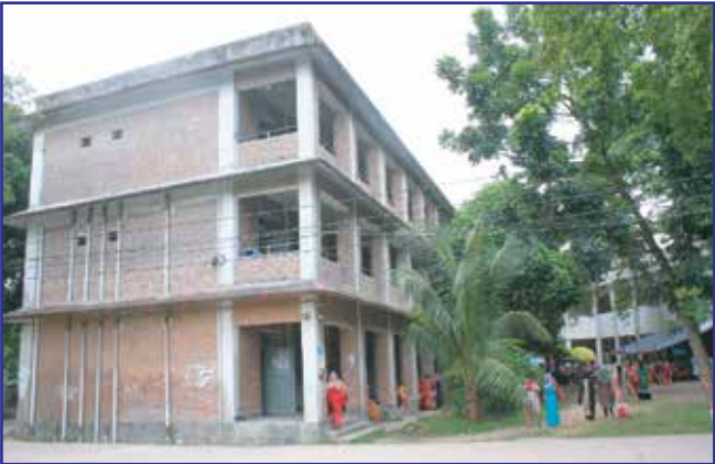
একাডেমিক ভবন (ভবন-৫)